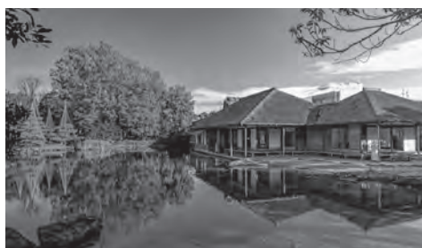
養浩館庭園 (福井市)