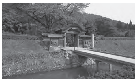
一乗谷朝倉氏遺跡 (福井市)